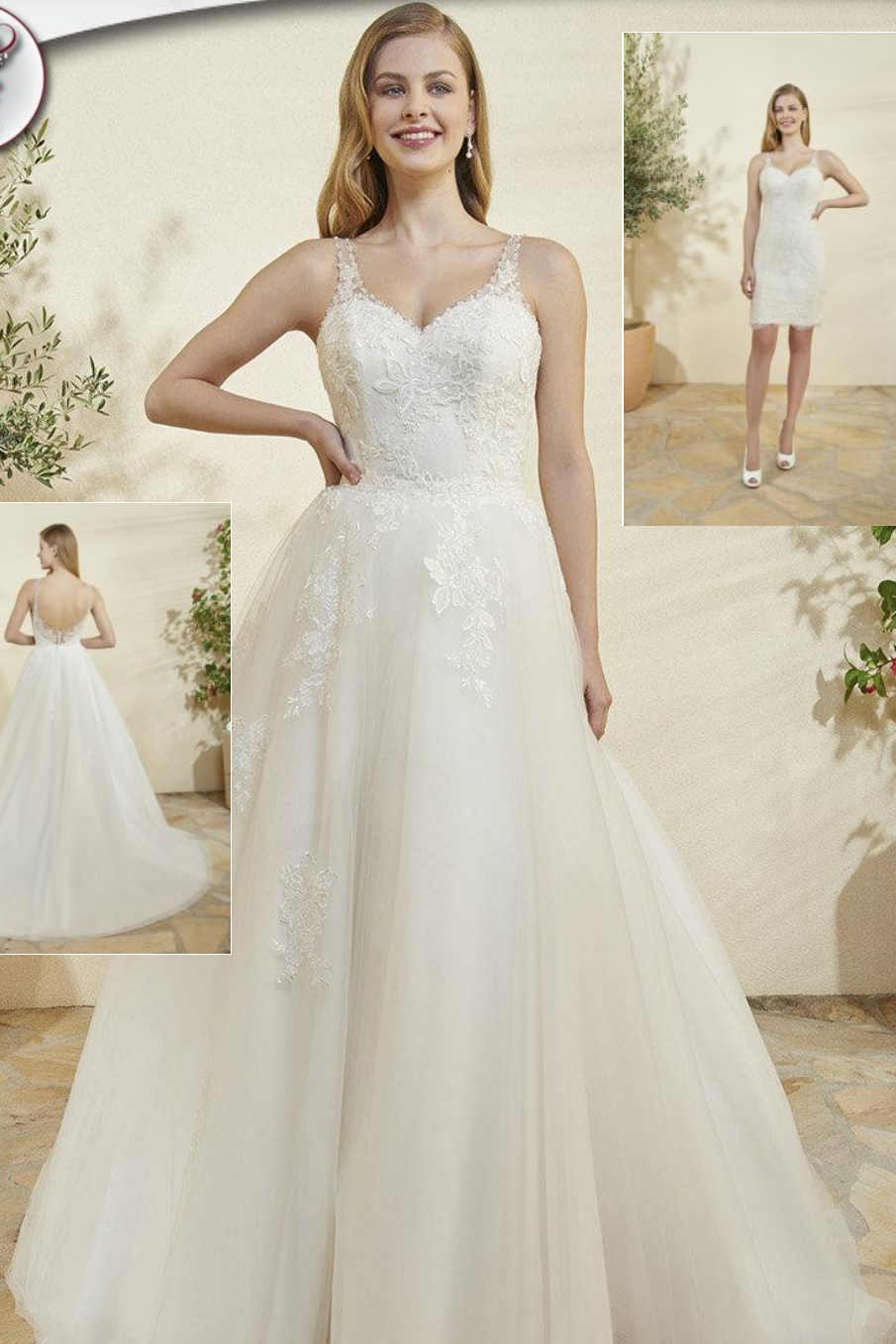
AD-2022-60 AC Reglisse