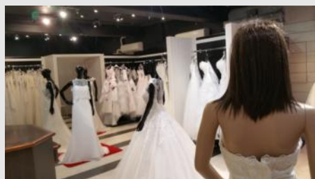
Plus de 100 robes en essayage