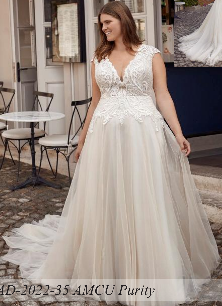
AD-2022-35 AMCU Purity